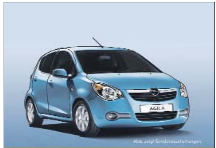
Abk. 2007 Sonderausstattungen